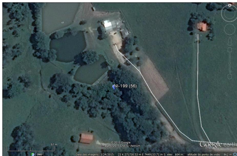
Foto 01: Imagem aérea, localização e em torno.